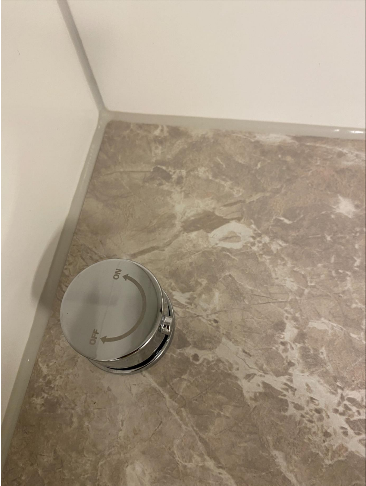
Figur 2 Avstängning av vatten till Tvättmaskin