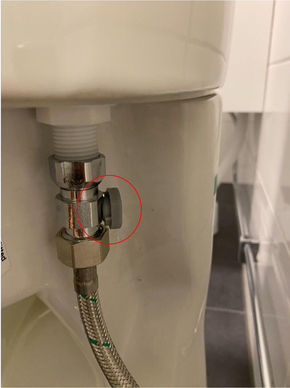
Figur 4 Visar avstängning till toaletten, stängs av genom att vrida på den grå brickan så att sträcket hamnar horisontellt