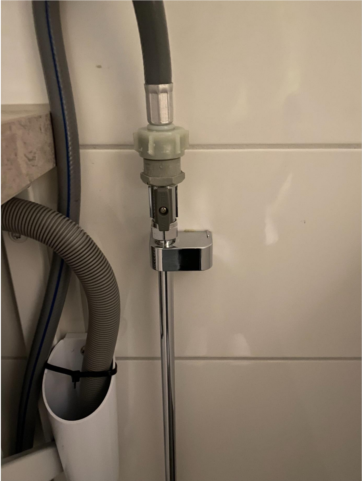
Figur 3 Vattenavstängning till kombimaskin